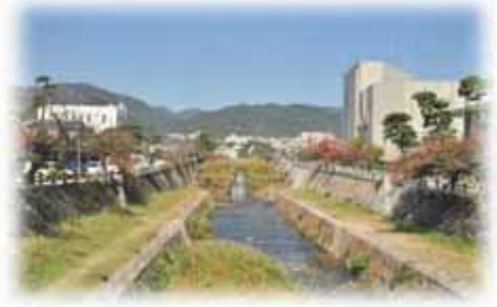
芦屋川，ルナ・ホール