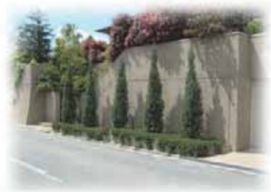
街並み景観を創出する外構緑化

今後もユニバーサルデザインの考えに基づき、関係機関と協力しながら、すべての人が利用できる施設を目指します。