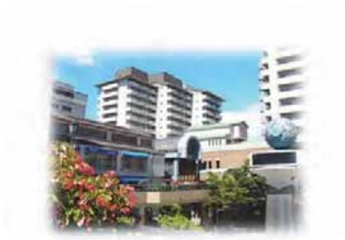
J R 芦屋駅周辺

また、阪神打出駅周辺と西芦屋町周辺の歴史的街並み景観の保全を図る地区を、山手地域の史跡・文化財等と結んで、市内全域の歴史環境の散策ルートとなるネットワークを形成します。