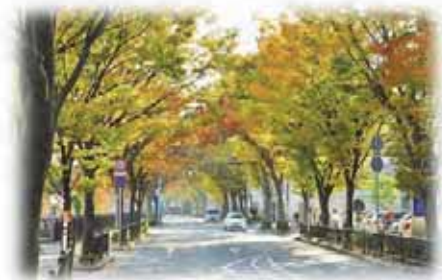
宮川線（宮川けやき通り）