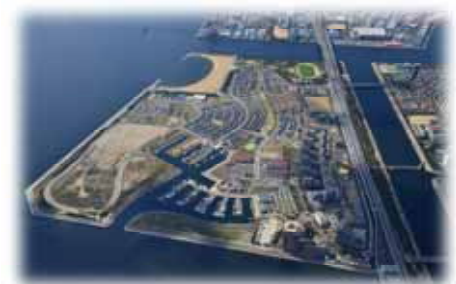
南芦屋浜地域（全景）

子供や高齢者がまちを散策して楽しめるように、ユニバーサルデザインに対応したまちづくりを進 めます。当地域は今後も多様な住宅や業務施設の整備、ノンステップバスの導入等を進めることから、 次世代を見越したユニバーサルデザインのまちとして、安心して快適なまちづくりに取り組みます。