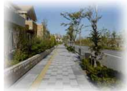
緑あふれる歩行空間

周辺地区の住環境に配慮し、南芦屋浜地域のまちづくりにふさわしい業務施設、医療施設及び生活利便施設等を配置します。