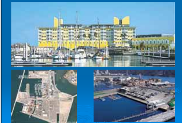
(4) 和歌山マリーナシティ (和歌山県和歌山市)