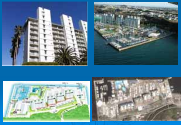
(1) シーボニアマリーナ (神奈川県三浦市)