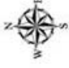
阪神間都市計画(芦屋)景観地区 芦屋景観地区 計画図