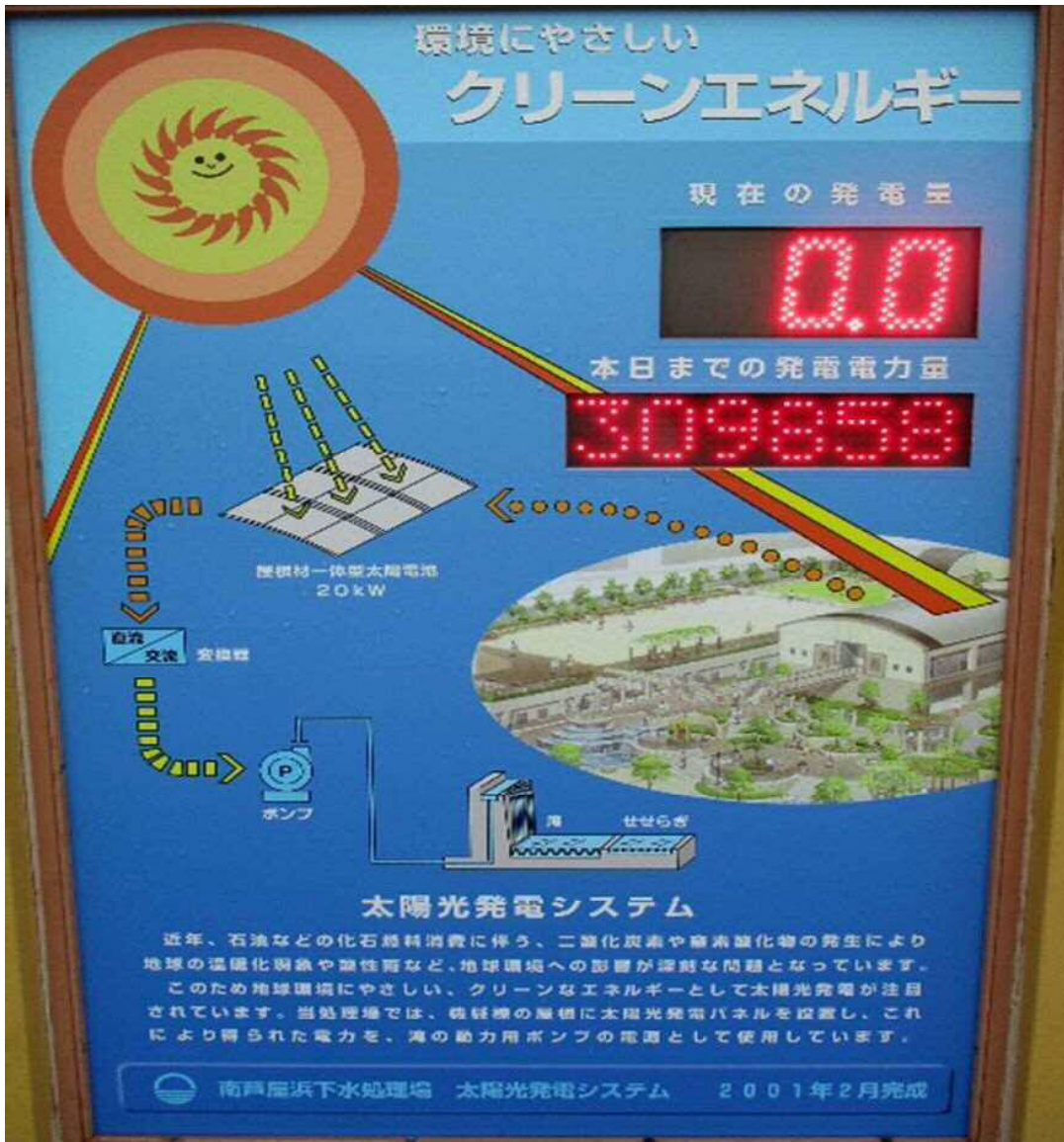
太陽光発電サイン