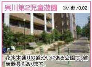
72 / 街 / 0.02 花水木通りの道沿いにある公園で、健康器具もあります。