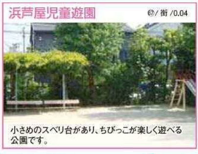
67 / 街 / 0.04 小さめのスベリ台があり、ちびっこが楽しく遊べる公園です。