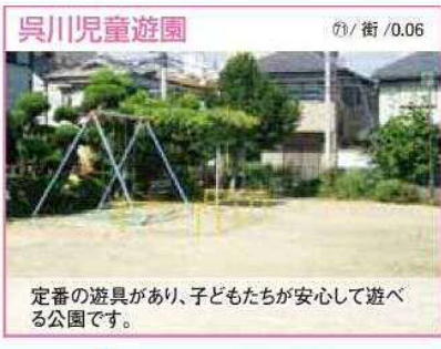
71 / 街 / 0.06 定番の遊具があり、子どもたちが安心して遊べる公園です。