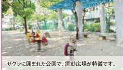
76 / 街 / 0.27 桜々に囲まれた公園で、運動広場が特徴です。