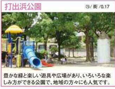
79 / 街 / 0.17 豊富な緑と楽しい遊具や広場があり、いろいろな楽しみ方ができる公園で、地域の方々にも人気です。