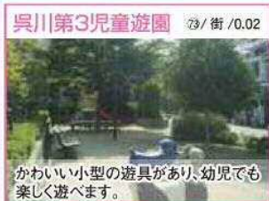
73 / 街 / 0.02 かわいい小型の遊具があり、幼児でも楽しく遊べます。