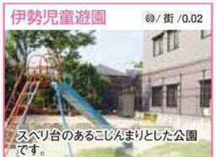
69 / 街 / 0.02 スベリ台のあるこじんまりとした公園です。