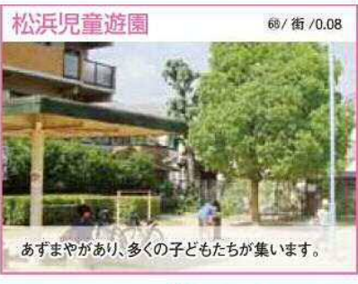
68 / 街 / 0.08 あずまやがあり、多くの子どもたちが集います。