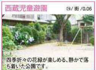
74 / 街 / 0.06 四季折々の花緑が楽しめる、静かで落ち着いた公園です。