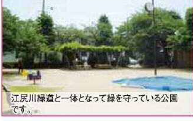
78 / 街 / 0.13 江尻川緑道と一体となって緑を守っている公園です。