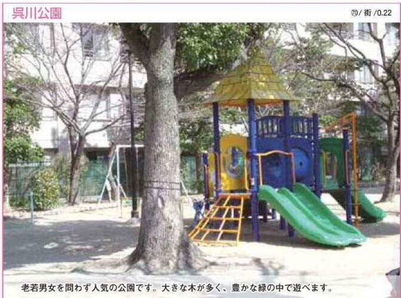
70 / 街 / 0.22 老若男女を問わず人気の公園です。大きな木が多く、豊かな緑の中で遊べます。