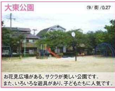
78 / 街 / 0.27 お花見広場がある、桜が美しい公園です。また、いろいろな遊具があり、子どもたちに人気です。