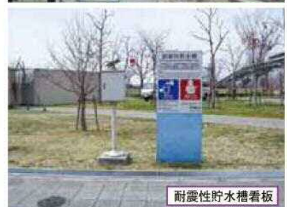
耐震性貯水槽看板