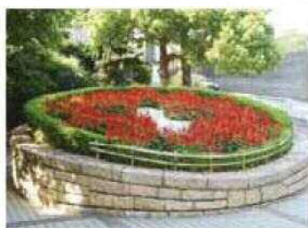
阪急芦屋川駅前広場

芦屋には花壇のある公園がたくさんあります。その多くは地域の方々がお花を育てているんですよ。