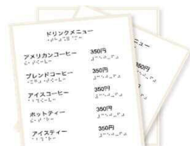
音声対応メニューを設置している