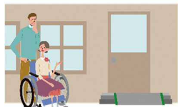
簡易スロープを完備している