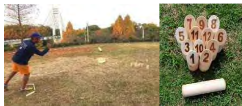
インクルーシブスポーツとしてモルックを楽しむ様子 モルック（棒）を交互に投げて、番号の書いたピンを倒し点数を競ったりして遊びます、

対してパラスポーツは、身体機能や知的発育などに障がいがある人が行うスポーツで、広く障がい者スポーツを表す言葉。