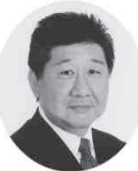
完全無所属 はせきひろあき

●ブレない!曲げない!初心を忘れずに! みんなの福祉健康都市あしや! 徹底主義宣言! みんなの福祉推進は私「はせ」の使命 教育の街あしや完全復活! 子どもファーストの徹底! 公立と私立の共存・日本一の教育を目指します。 めざそう 国際環境都市 あしや! 住みやすさ No.1芦屋の復活 ペットと住み続ける街づくり みんな集まれ!