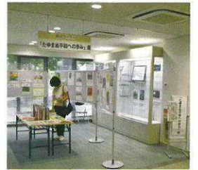
平和に関する絵本の展示 (平成29年10月)