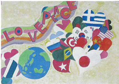
平成29年度 教育長賞

※入賞者は、8月19日(日)開催の「ヒロシマ原爆展」オープニングセレモニーにて表彰します。