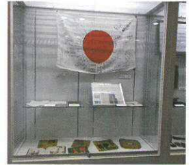
市所有及び市民寄贈の戦争資料 (平成30年5月)

※期間中、NPO法人「絵本で子育て」センターの絵本講師による解説を下記の日程で行います。(展示している絵本を読むことができます。)