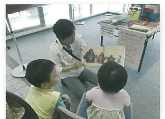
平和の絵本読み聞かせ （平成30年7月）