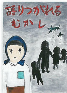
平成30年度広島平和記念資料館長賞