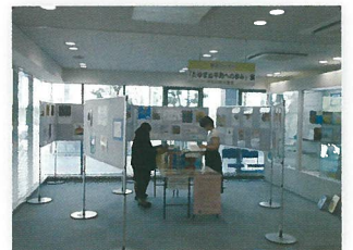
平和に関する絵本の展示 （平成30年7月）