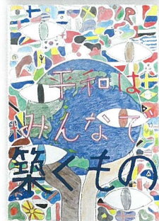
平成30年度教育長賞