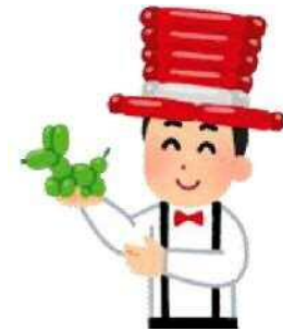
学校校庭の バルーンアート