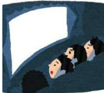
精道小学校体育館映画