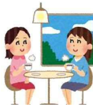
リードあしやのカフェ