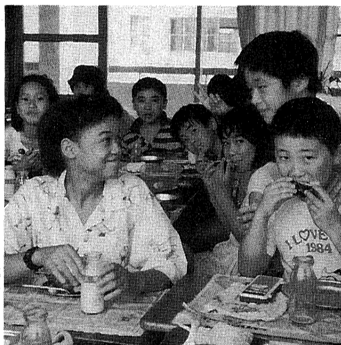
米国・シカゴのマリー校との交流会

机上の資料に頼るだけでなく、学級から野外へ出て体験しながら思考力を深めていく。 授業効率を一層上げるため、どんなときにどんな教育機器を活用したら良いか——など。 こんな目標に向けて、子供たちが自ら課題を知り、解決していくための学習意欲を起こさせる試みが、徐々に実を結びつつあります。