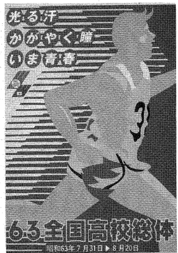
高校生の作品によるポスター

五十九年に奈良わかき国体でヨット会場になって以来のもので、開催にむけて、芦屋市実行委員会（事務局＝体育館・青少年センター内）がその運営の準備に当たっています。