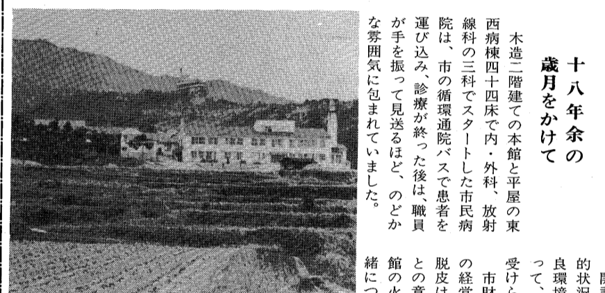
開設当時の市民病院