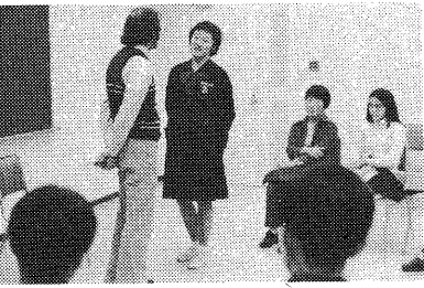
英会話クラブのひとコマ

現代の子どもは、おとなの常識の社会で生活させられています。それは、子どもがやんちゃを發揮できる社会とはいえません。そこでセンター内に一つのコーナーを設けました。昔見られていた、ふすまや壁やへいらくがきをしている子どもの風景をセンターに再現し、子どものかすかな欲求を發散できるように、らくがきコーナーを發揮させてあげてください。