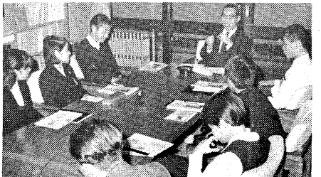
北村 三年生のとき転校するの

水田 幼稚園の頃、寝るときに父が一日一冊づつ本を読んで聞かせてくれたんです。だんだんそれに引かれて。