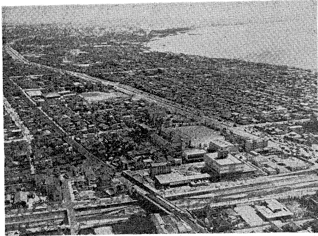
住居表示第1期整備にとりかかる阪神電鉄から南の区域

このごろ、市外の知人から住居表示の実施による地番の変更を知らせるお便りを、受け取られることが多くなっています。もともと従来の地番は土地を表現するためのいわば財産番号なのですが、これを慣行的に住所表示として用いていたため混乱が起きているようです。そこで各市では、「住居表示に関する法律」(昭和二十七年)にもとづいて、住居表示の整備をすすめています。 芦屋はその点、比較的はつきりした街区と整った地番を持つっており、他に見られるような町名とか地番の混乱が少ないところからこの事業の着手は遅れていました。しかし将来、市街地一筆の土地の大きい部分などは混乱をきたすおそれがあり、それは市民生活や行政事務の遂行にも不便が予想されますので、五カ年計画で街区方式による住居表示整備にとりかかることになりました。 計画では、まず市街地を五つの区域に分け、阪神電鉄以南の一・八平方キロを第一期整備区域とします。区画整理が進行中の阪神