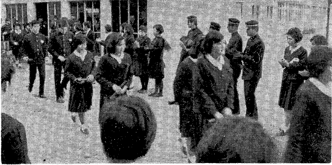
後輩たちの拍手に送られて校舎を後に