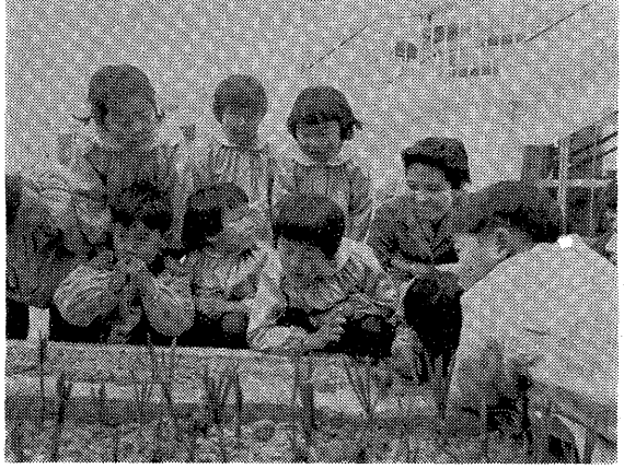
ほくらの植えたチューリップ、早く大きくなれ

日ながめながら、卒園の目を待つていきます。記念にわたる手形の葉巻もできませぬ。先生がたも同園をあとにする子供たちの心に、いつまでも残るような、また、同園で将来も引きつられていくような形式の第一回卒園式にしたい、と先日来、よりよりの日次第を相談しています。また、小種幼稚園に紙はいがあられまきでしたので、在園中、子供たちが胸あそびで紙はいを紙はいに作って残しておこうと、こころから計画しています。