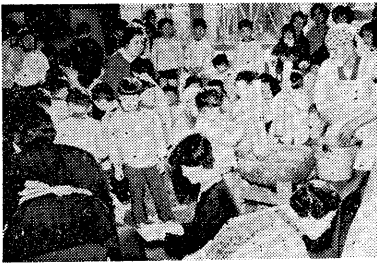
おモチつき 一月二十五日、幼稚園では、寒...