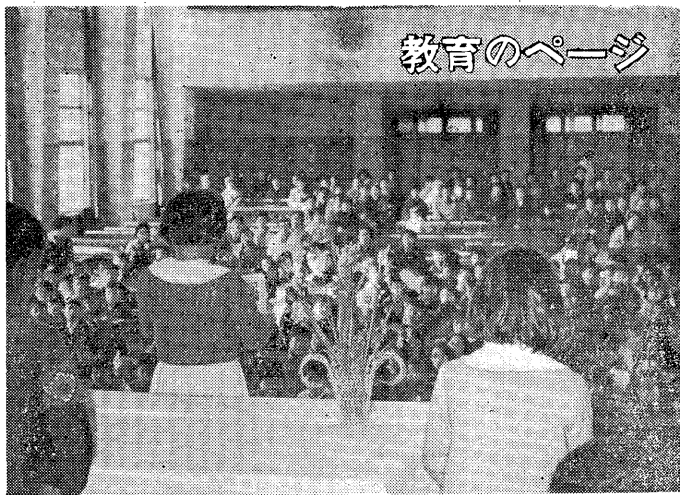
好評を得た精道小学校の学習発表会