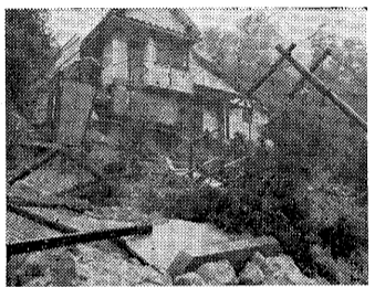
山麓で起ったガケくずれ

六月二十四日から数日にわたって各地を襲った豪雨は、芦屋市においても降雨量三六七・二ミを記録し、浸水、ガケくずれなどの被害をもたらしました。市では、二十六日早朝、市役所一階もなかつたこと不幸中の幸内に災害救助隊本部を設け、たまたちに被害および救援対策を行ないました。被害の多かったのは打出の低地域、宮川流域、新築地の造成が行なわれた山麓地帯です。中でも西宮市域において二日にわたって決壊した堀切川下流の大東町住宅街をはじめ南宮、具川、伊勢町等の三四〇世帯が床上浸水し床下浸水は更に二十九町におよびました。市内の山麓に位置する全町で、大小のガケくずれや石垣くずれ三十力所ほど生じ、これらに起因して数カ所に通行不能の箇所も生じました。しかし、市民にひとりの死