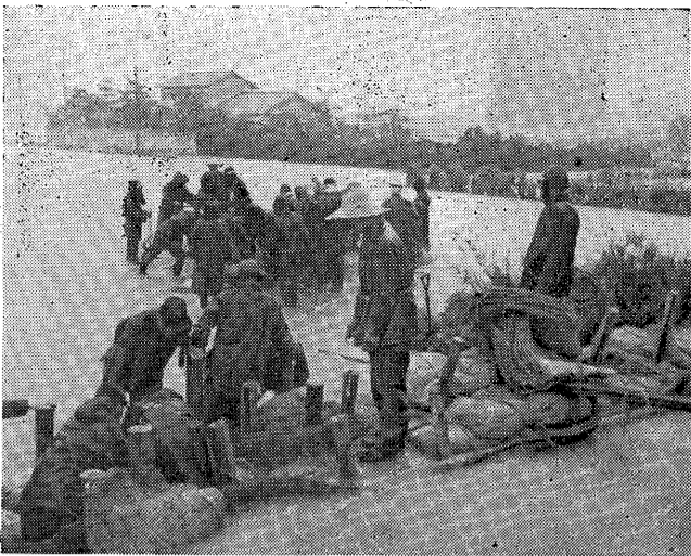
決壊した堀切川で奮闘する水防団員

六月二十四日から数日にわたって各地を襲った豪雨は、芦屋市においても降雨量三六七・二ミを記録し、浸水、ガケくずれなどの被害をもたらしました。