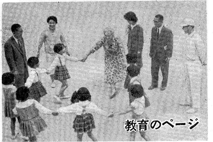
「かごめ、かごめ」と宮川小児童と興じるガンブリル博士(中央)