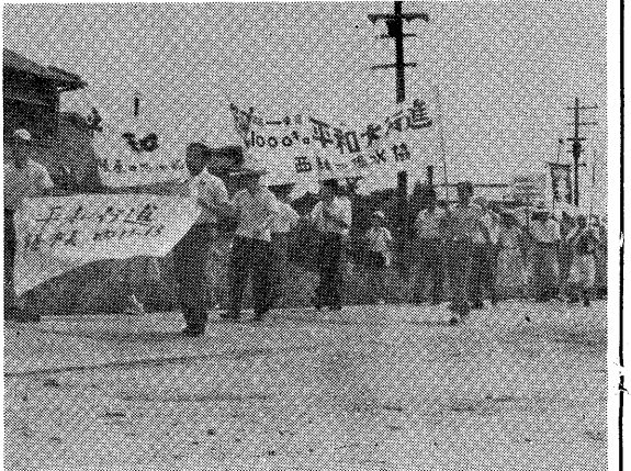
原水爆禁止をめざす広島—東京1千キロ平和行進の一行が7月8日本市を通過(上写真)また長崎—東京自転車リレーも8月1日通過、ともに市民の盛んな歓迎を受けました。

全市平均で五月十三日に十分間十七回開かれた警備は、六月一日運動開始と同時に三回になり、六月十日以後十日以上の調査でほぼ二回を保持してきまして、七月十日の調査では一・五回とわずかながら増加の傾向が見え、心をもめてはならぬと思えます。