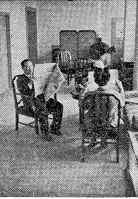
新装成つた快適な館内ロビー この向つて左側に大集会室2室があります。

せいぐ御利用を 芦屋川西岸、国道のすぐ北の佛教会館三階が私たちが芦屋市民のための公民館です。大小三つの集会室があり、テレビ・電音・新聞・雑誌類・湯茶の設備をそろえて皆様の御利用をまつて ① 営利・宗教・政治的なこと以外あらゆる社会教育、文化的、公共的な集りにせいで御利用下さい。 ② 書道講座 毎木曜夜開講中 ③ 美術教室 5月より火曜夜 ④ わくわく公民館(電五三三六)