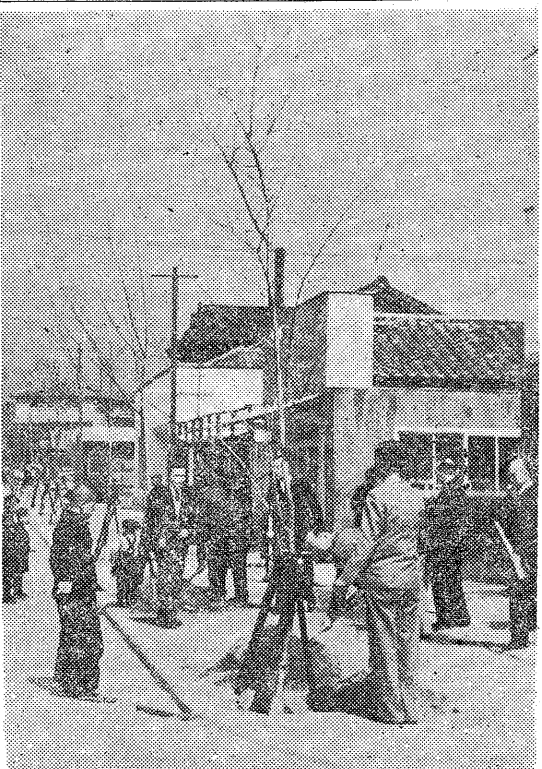
柳櫻をこきまぜて 緑化運動の一環として植樹祭が四月三日午前...

死亡転居の場合 一月一日以後に納税義務者が死亡したとき... 祝祭日には国旗を掲げまじよう