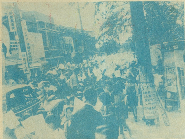
日の丸の旗々…………… ——学童の旗行列