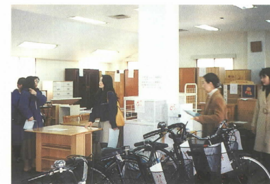
問い合わせ 環境施設課 ☎32-5391

自転車、家具類などリフォーム可能な資源を大型ごみの中から回収し、リフォーム後、再生品として市民の皆様へ再利用いただきます。今年には既に3月に実施し、約900人の来所者がありました。次回の展示会は7月を予定しています。この事業は、年間3回程度行う予定です。大いに御利用ください。