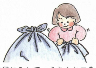
●袋に入れて、きちんと口をしめて