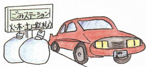
●ごみステーションに車を止めないで