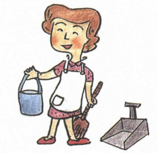
●みんなで協力し、ステーションを美しくしましょう