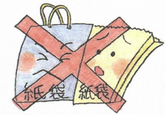
●袋はポリ袋を使って不燃ごみは透明な袋で