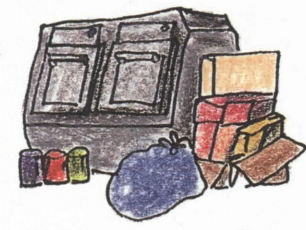
これは困りましたネ

で、それぞれ回収カゴ、回収箱に入れてください。 ガラス類、陶器類、蛍光灯などは、真空集塵投入口に入れてください。 ●新浜町全域・潮見町全域・浜風町の一部・緑町の一部(回収カゴ・回収箱を設置していない地域)は、不燃ごみを分けて「カンの日」「ビンの日」「その他不燃ごみの日」にそれぞれ、所定の所へ出してください。問い合わせは環境施設課へ(☎5391) ☆ 大型ごみをだす場所に違つものが出されて、処理困難になつています。 ☆ 引っ越しごみは、各自の責任で処理することになっていきます。市に収集の申し込みをしてください。 (特別収集ごみ)有料 ☆ ごみステーションは、一人一人がルールを守り、いつもきれいにしましょう。 ☆ 真空集塵投入口が満杯の時等は、赤い表示になります。その場合は投入できませんのでお待ち帰りください。近くの利用できる投入口を利用していただくで結構です。また、深夜の方への投入音は、投入口付近の方にとっては、意外に大きく感じられるものです。ちょっとした心使いで快適な生活を!