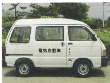
平成2年度から順次メタノール車電気自動車を導入しています。

芦屋市では環境にやさしい低公害車の普及に取り組んでいます。事業者の方にも、電気自動車等を購入する場合には、従来よりも充実した助成制度にいたしましたので、ご利用ください。