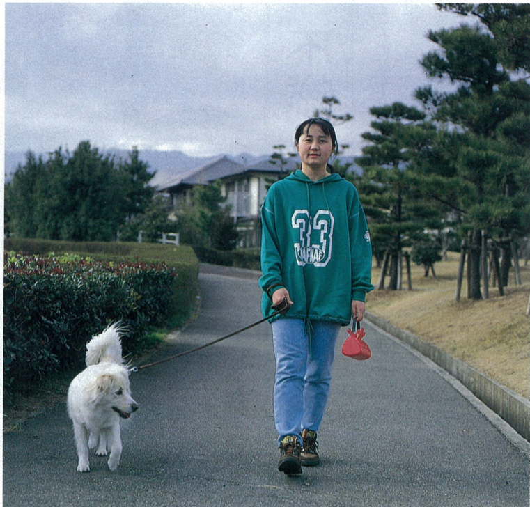
マナーを守って楽しい散歩

近ごろ、目に付く困りもの。 タバコのポイ捨て、犬のふん。 汚した人は、何も感じていないのでしょうか。 ボランティアの方や自治会の方が、清掃活動をしておられますが、なによりも「汚さない」ことが基本です。