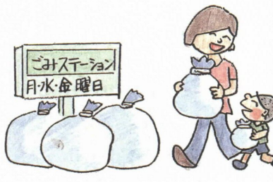
●必ず、決められた日時、決められたステーションへ