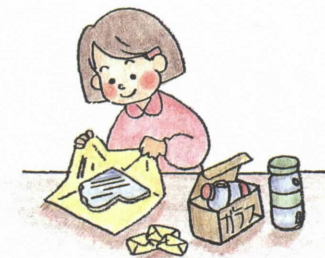
●割れたガラスなどは容器に入れるなど、わかるように