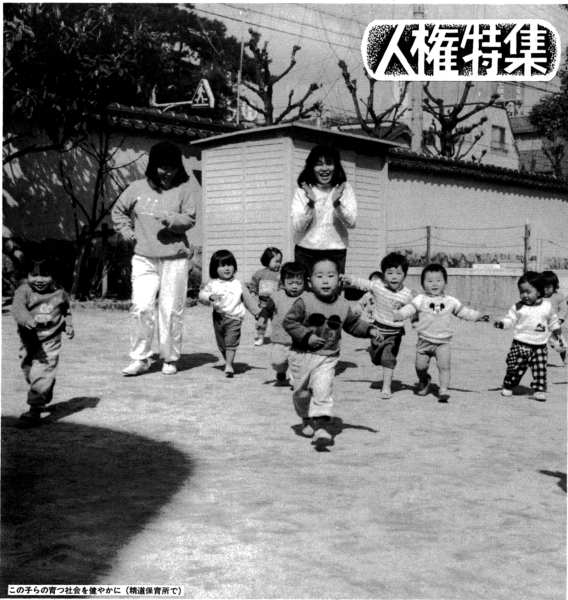
この子らの育つ社会を健やかに（精道保育所で）