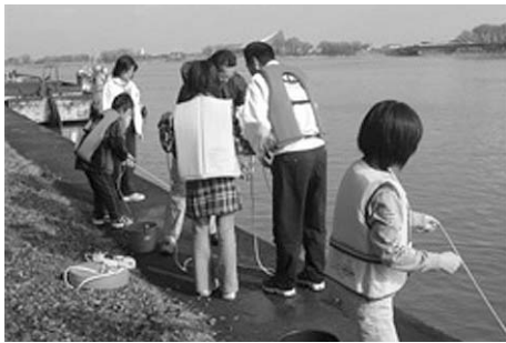
②県立水環境科学館