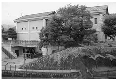
④琵琶湖疎水記念館