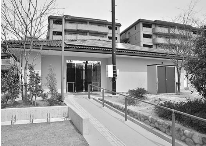
新たにオープンする地区集会所「三条集会所」