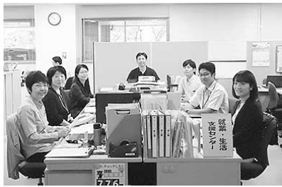
障がい者就業・生活支援センター

障がいのあるかたの就業に関する相談窓口を設けています。就職活動を進める上で、仕事や適性について考えたり、就職に関する手続きなどの支援を行います。また職業訓練の紹介や就職しているかたの相談にも応じています。