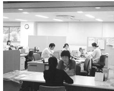
障がい者基幹相談支援センター

社会福祉士や精神保健福祉士の専門資格を持った4人の相談員が障がいの種別に関わらず、生活上のお困りごと、福祉の制度のこと等さまざまな相談に応じています。お気軽にご相談ください。※障がい者手帳の有無に関係なく相談に応じます。※相談は無料・秘密は厳守します。