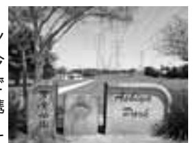
モンテペロ市「芦屋公園」