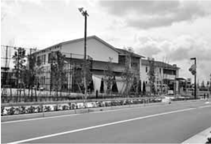
潮芦屋交流センター

■発行/ 芦屋市役所 ☎ 31-2121 〒659-8501 芦屋市精道町7番6号 ■問い合わせ 国際交流担当 ☎38-2008/☎38-2175 〒659-0035 芦屋市海洋町7番1号 ■ホームページ http://www.city.ashiya.lg.jp/sankaku/kokusai/jigyou.html