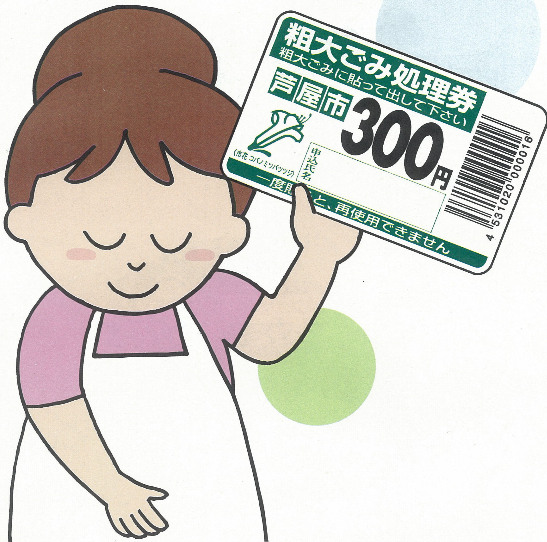
平成13年9月 大型ごみ(粗大ごみ) 収集日

現在、粗大ごみ(大型ごみ)は4週に1回収集していますが、これを廃止し、申し込み制による予約収集になります。