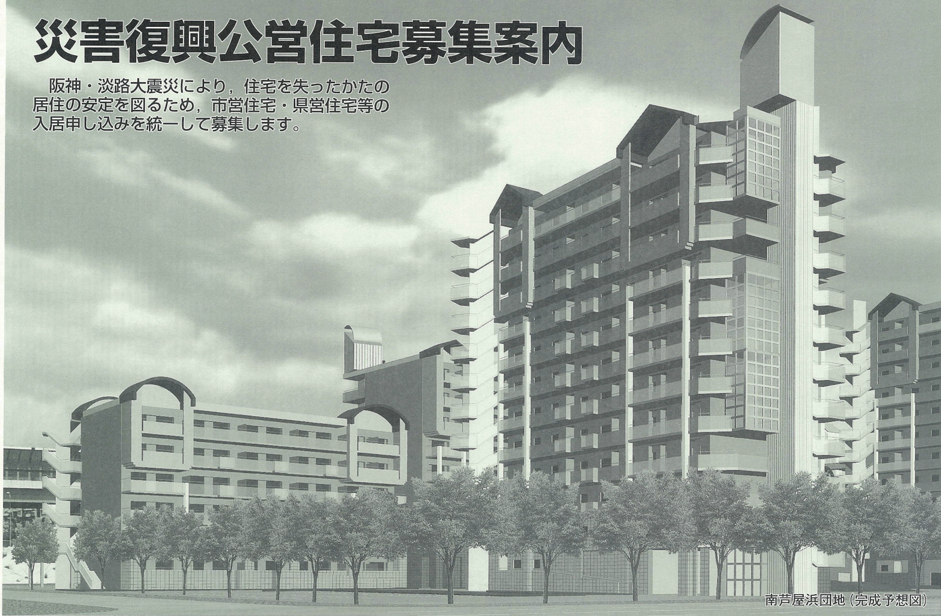
南芦屋浜団地(完成予想図)

阪神・淡路大震災により、住宅を失ったかたの居住の安定を図るため、市営住宅・県営住宅等の入居申し込みを統一して募集します。