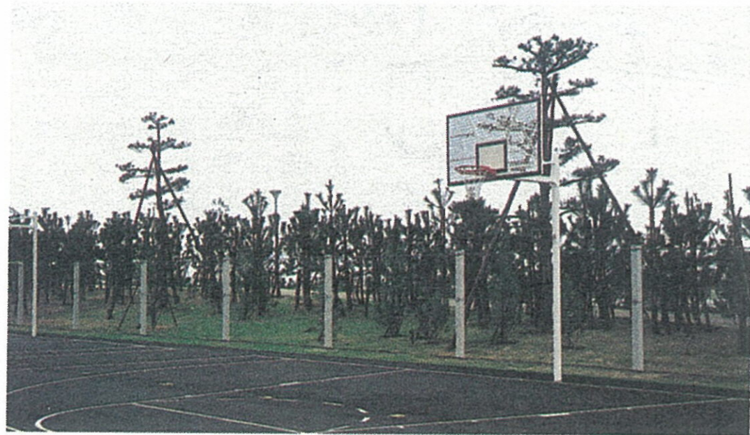
第1スポーツコート

(使用時間) 1～3月、10～12月……… 9時～17時 4～10月……… 9時～19時 総合公園会議室……… 9時～17時