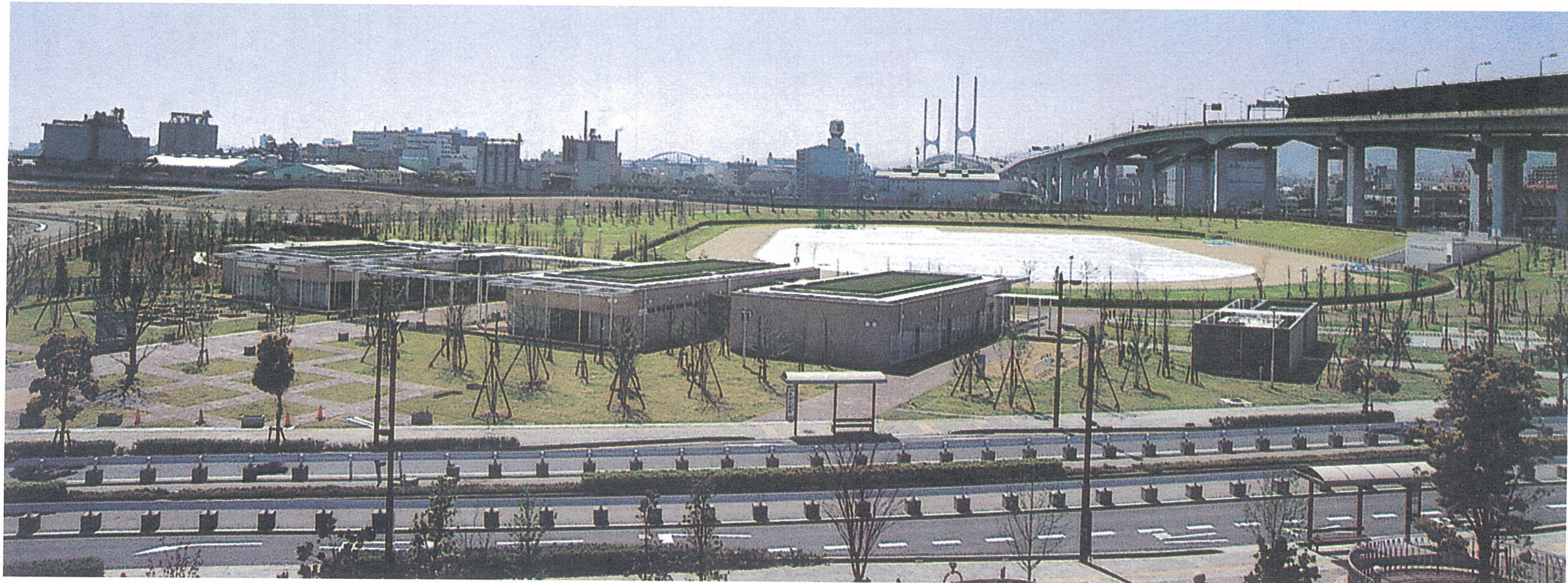
芦屋市総合公園全景