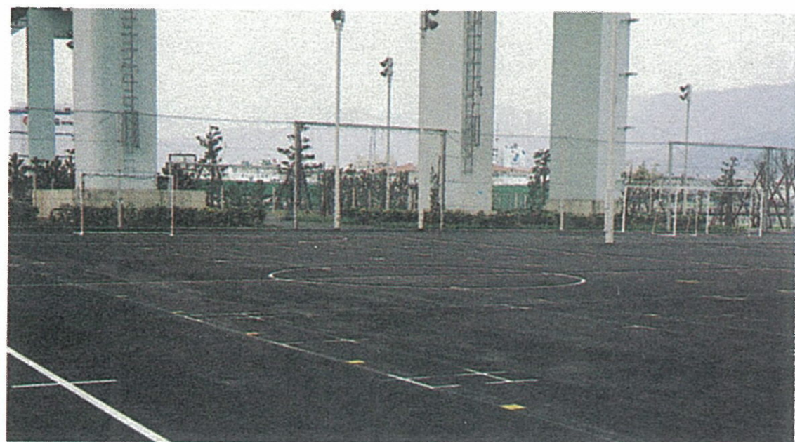
第2スポーツコート