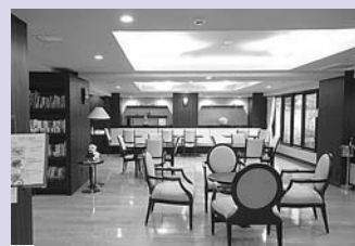
① 芦屋アラベラの家