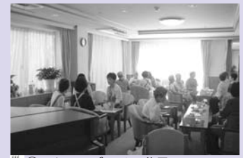
② アクティブライフ 芦屋