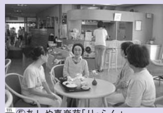
⑤ あしや喜楽苑「リ・らん」