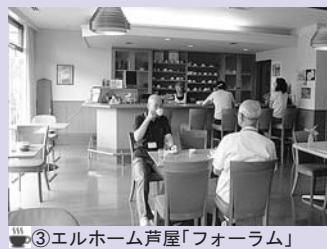
③ エルホーム芦屋「フォーラム」