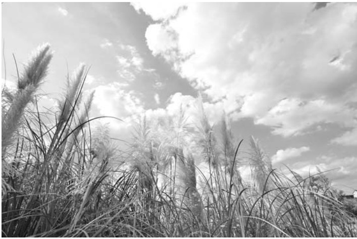
パンパスグラス (親水公園)

■発行/ 芦屋市役所 ☎31-2121 〒659-8501 芦屋市精道町7番6号 ■問い合わせ 高年福祉課 ☎38-2044 介護保険担当(保険料) ☎38-2046 介護保険担当(介護認定・給付・予防) ☎38-2024