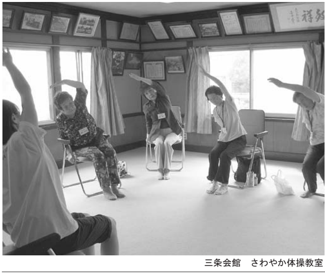
三条会館 さわやか体操教室

●発行/ 芦屋市役所 〒659 - 8501兵庫県芦屋市精道町7番6号 ●問い合わせ 高年福祉課 ☎38-2044 介護保険担当 保険料 ☎38-2046 要介護認定・介護サービス ☎38-2024