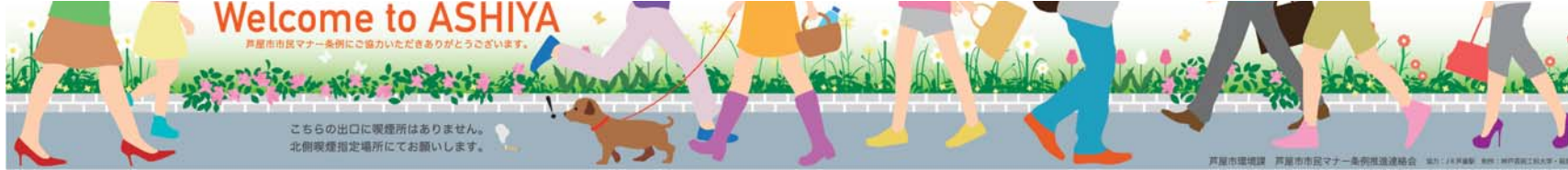
J R芦屋駅構内に3月に設置した「市民マナー条例啓発パネル」 制作:神戸芸術工科大学

誰もが憧れる美しいまち「芦屋」にごみは似合いません…よね？ ～スマートな暮らしは足元から～