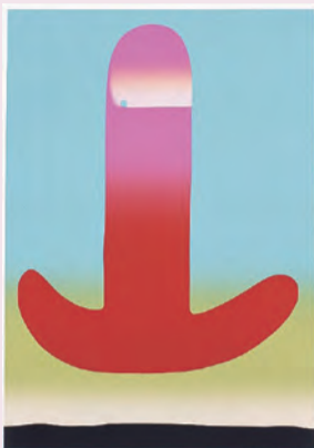
元永定正《あかのうえ》(ほへとシリーズ)より1986年シルクスクリーン、紙

本展担当学芸員が、展示室内で解説を行います。展示会の見どころや、作品・作家にまつわるエピソードなどをお話しします。