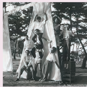
野外具体美術展(1956年、芦屋公園・兵庫)

当時の「具体」をとりまく状況や、元メンバーとの交流などで自身の経験をお話いただきます。