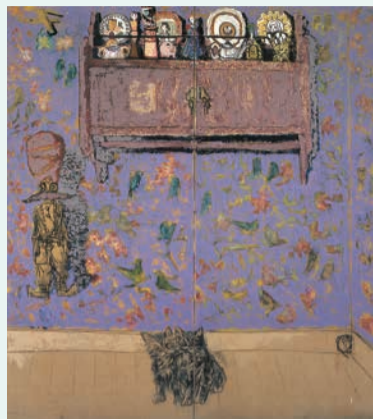
伊藤継郎《猫のいる風景》1940年頃 油彩、布 美術博物館蔵