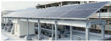
西蔵こども園太陽光パネル

芦屋市では、令和4年4月から市内の公共施設10カ所で、6月からは市内の学校園12カ所、本庁舎・分庁舎・公光分庁舎南館で再エネ100%電力を導入し、年間約2500tの温室効果ガスを削減することができました。今後も公共施設の省エネ化の検討と再エネ電力の導入を進めます。