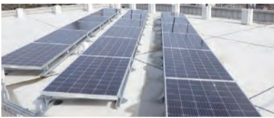
芦屋市霊園事務所太陽光パネル