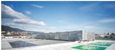
精道中学校太陽光パネル