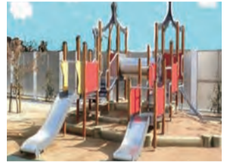
市立西藏こども園子育て支援拠点