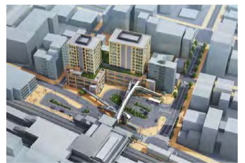
JR芦屋駅南地区再開発事業