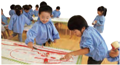
市立岩園幼稚園3歳児保育