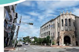
芦屋川地区無電柱化