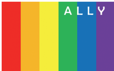
阪神7市1町共通啓発ロゴ

市民・事業所の皆さんも共通啓発ロゴをチラシやパンフレット、ホームページなどに活用いただき、性的マイノリティに対する理解促進にご協力ください。※ロゴの使用を希望される場合は、ご連絡ください