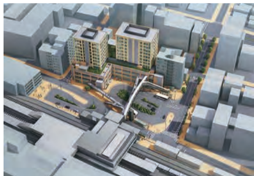
JR 芦屋駅南地区完成イメージ

JR 芦屋駅南地区で現在進行している再開発事業について、職員が直接ご説明します。希望される人は下記へご連絡ください。