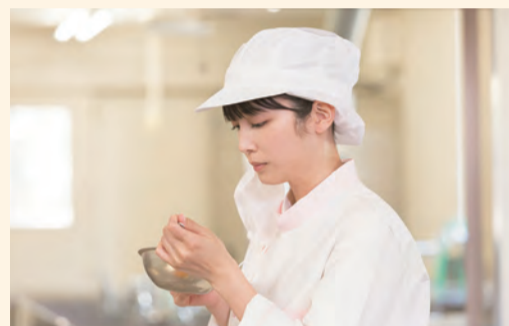
映画「あしやのきゅうしょく」より

1995年10月生まれ、沖縄県出身。2006年デビュー。2016年ドラマ『仮面ライダーエグゼイド』にヒロインの仮野明日那 / ポッピーポパポ役でレギュラー出演。2018年にはドラマ『賭ケグルイ』の熱演が話題になり、その後2020年NHK連続テレビ小説『スカーレット』に出演。2021年の舞台『ヒミズ』ではヒロインを演じた。出演映画には『賭ケグルイ』シリーズ(19/21)、『映画 としまえん』(19)などがある。