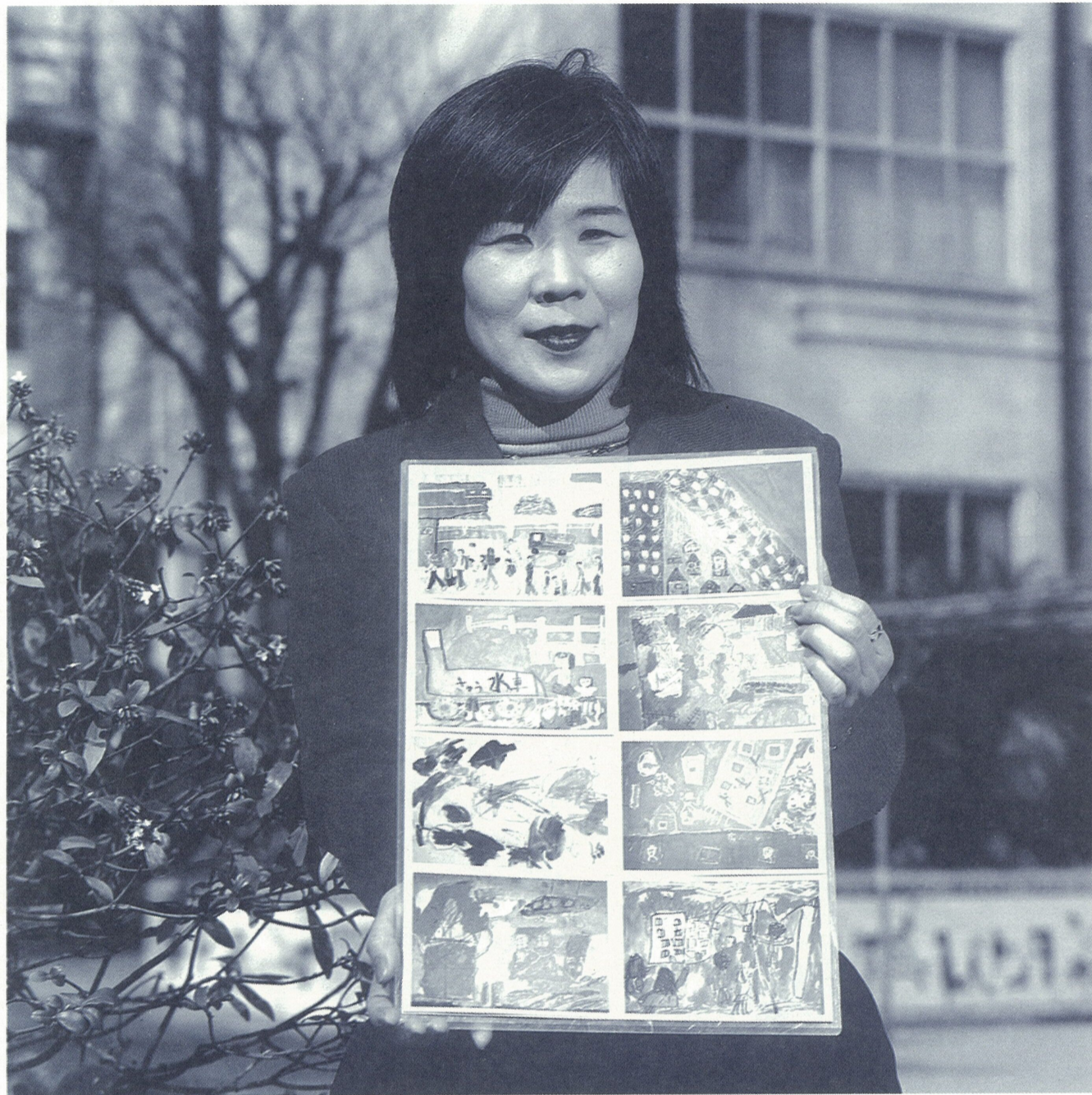
演出/大森一樹(映画監督)