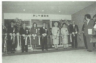
1月14日、開所に先だって竣工式が行われた

お問い合わせ 高年福祉課 ☎38-2044 あしや喜楽苑 潮見町三十一 ☎34-9287