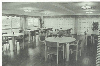
地域交流のスペース(喫茶ルーム)

今回の開所にあたっては、多くのボランティアや地域の皆さまから協力をいただきました。この交流を大切に、入居者が地域社会の一員としていきいきと暮らせるよう、施設の一階部分に地域交流スペースを設けました。入居者だけでなく、誰もが憩いと団らんのかたまりとして利用できるようなっています。ぜひお気軽にお越しください。