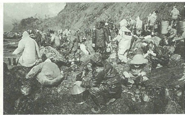
福井県美浜町での重油回収作業

お問い合わせ 高年福祉課 ☎38-2044 あしや喜楽苑 潮見町三十一 ☎34-9287