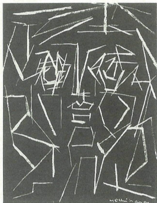
吉原治良のドローイング

二月から三月にかけての美術博物館の展示は、「芦屋の美術を探る」吉原治良のドローイング 一九四五—一九五五です。ドローイングとは、油絵など完成した作品にいたるまでに数多く描かれる下絵、スケッチあるいは基礎的な絵の勉強のために描かれる素描(デッサン)などのことを指します。