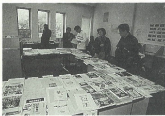
震災関連資料に見入る市民

図書館では昨年(去年)に続き、1月14日から23日まで「震災資料展」が開かれ、777人のかたが訪れました。震災関連資料の収集に努めてきた図書館が、まちと文化の復興と創生を願って企画したものです。 18・19日は図書館前に消防署の災害救助車Ⅲ型が出動し、運転席に座らせてもらったり、細部をじっくり見ることができ、子どもたちの人気の的でした。 図書館で資料として収集した約500点の図書・雑誌・新聞はもとより、パンフレットや地図・写真等も展示され、この1年間の震災関連資料の充実ぶりが目を引きました。 また、市民のかたが作成した芦屋市関連の震災資料リストが提供されるなど、市民の皆さんとの協力関係が新たに生まれました。 震災関連資料は今後も充実させていく予定で、市民の皆さんからの寄贈も受け付けています。