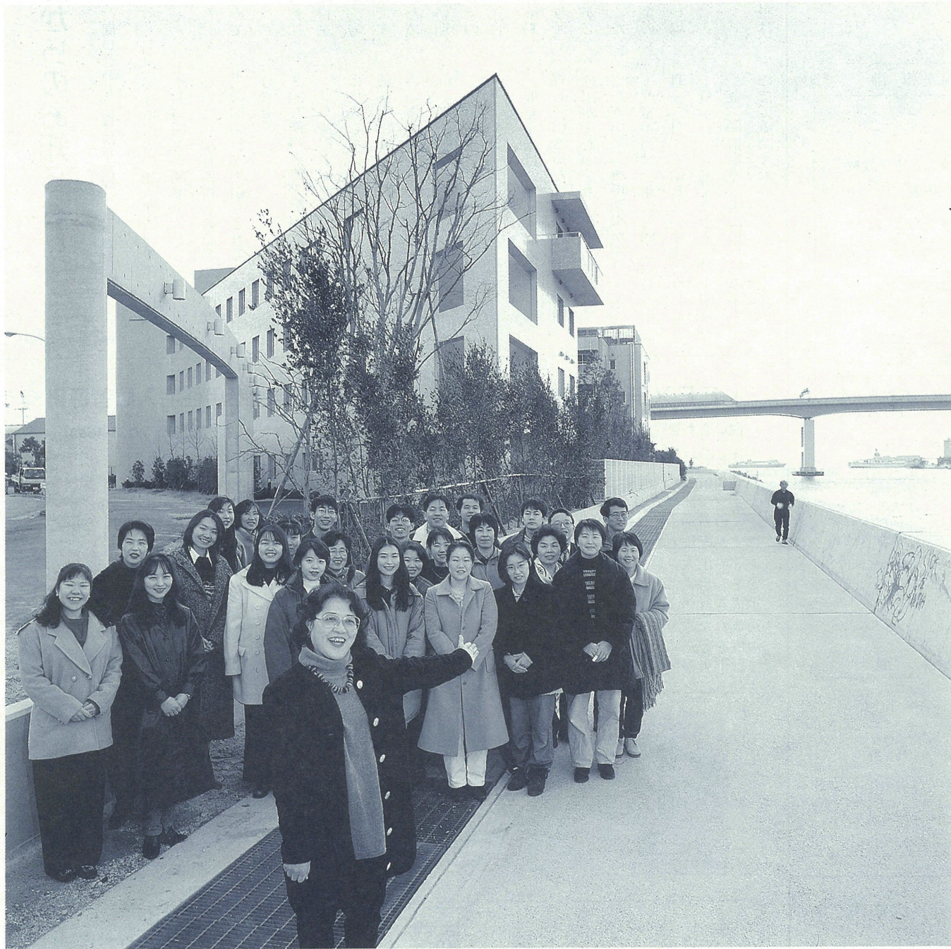
監修/大森一樹(映画監督) 題字-再生の芽-北村春江(芦屋市長)