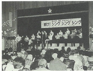
アシヤユースコーラスの歌唱指導による会場内大合唱

1月19日(日)、阪神・淡路大震災から2年が過ぎ、希望と勇気を持って3年目に向かって歩いていこうと「～震災2年 芦屋・あすに向かって～響けノシング シング シング」が開催され、約500人の人々が力強い歌声に聞き入りました。女声コーラス『彩』が「おぼろ月夜」「茶つみ」など唱歌メドレーを、『合唱団ボイスフィールド』がディズニーの名曲を披露し、『芦屋少年少女合唱団』が「靴が鳴る」「赤い靴」などを、『山手コーラス』は日本のうたの数々を、『アシヤユースコーラス』が「いい日旅立ち」等を歌い、バラエティに富んだプログラムで訪れた人々を楽しませました。 また、『アシヤユースコーラス』が歌唱指導し、「遠くへ行きたい」「見上げてごらん夜の星を」を出演者・来場者全員で歌うなど、震災の悪夢を忘れるとても楽しい1時間30分でした。仮設住宅に住んでいる女性は「50年前に戦争で家をなくし今回も家が全壊したが、久しぶりに大きな声で歌って、今晩はビールがおいしく飲めます」と晴れやかな顔で語っておられました。