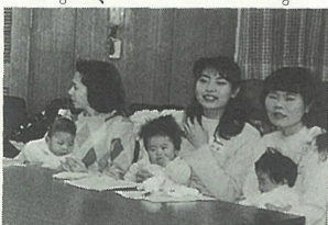
「なかよし育児教室」より