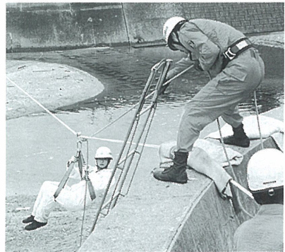
台風に向けて防災訓練を実施

防犯週間の去る八月三十日には、防災訓練を実施し、地滑りの予想される地域と高浜町の仮設住宅のかたがたに避難訓練をしていただきました。市は今回の震災の経験・教訓を生か