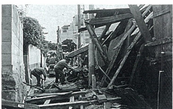
解体のはじまる蔵

市指定文化財小阪家住宅の所在する三条町は、江戸時代から明治にかけての旧家が建ちならび歴史的景観を今に伝える地域です。地震直後、小阪家の蔵は倒壊し、さまざまな資料が露出してしましました。当初、シートを掛けて雨を防ぐのがやっとでした。幸い、近隣の大学生・ボランティアを中心とする文化財レスキュー隊の協力を得て資料を保護することができました。