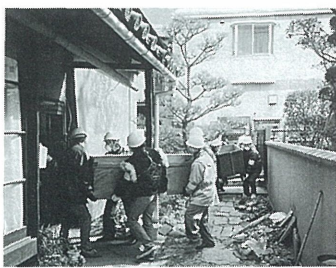
小阪家住宅へ運びこまれる資料

美術博物館では、所有者のご協力を得て、分類整理をし、貴重な文化財資料として、館の歴史展示場で順次公開していくとともに、本紙で、その主な内容について紹介いたします。