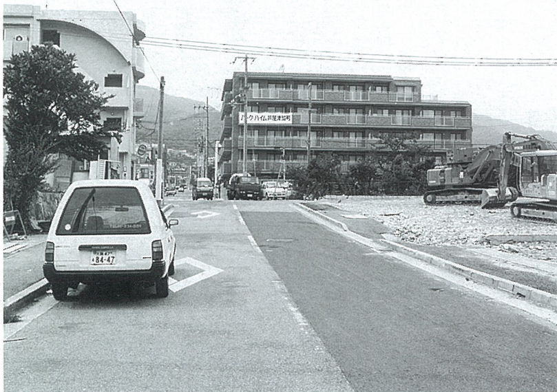
被害の大きかった津知町のまち並みの変化 (上: 1月撮影、下: 7月撮影)