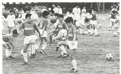
◎総合問い合わせ 体育館・青少年センター体育係 芦屋市川西町15-3 ☎22-7910